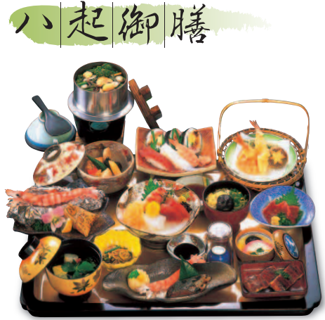
16-31 八起御膳 (松) 本体価格 4,000円 (消費税別)

通常価格 6,000円を 特別価格 5,000円 (通常より1,000円お得) 消費税込