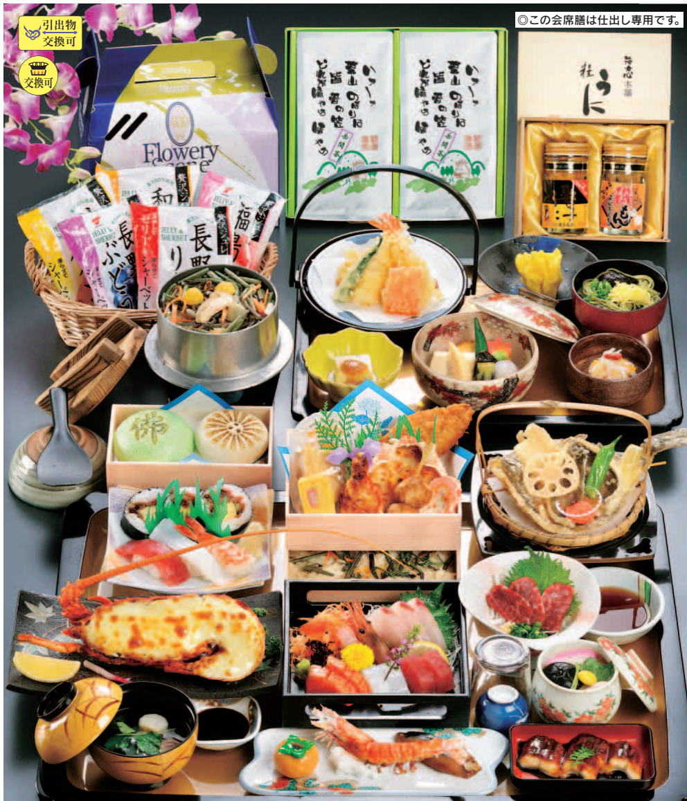
01-01 仏事用会席膳 (引出物・詰合せボックス・釜飯付)

通常価格 10,000円を 特別価格 8,500円 (通常より1,500円お得) 消費税込