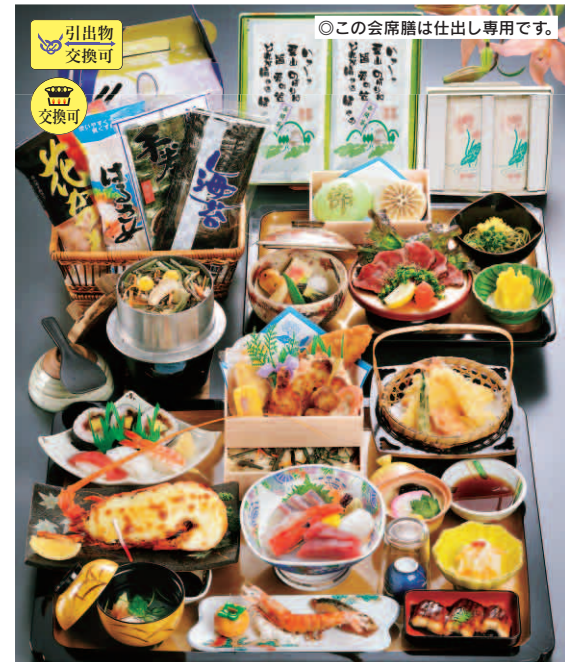
05-05 仏事用会席膳 (引出物・詰合せボックス・釜飯付)

通常価格 8,500円を 特別価格 7,200円 (通常より1,300円お得) 消費税込