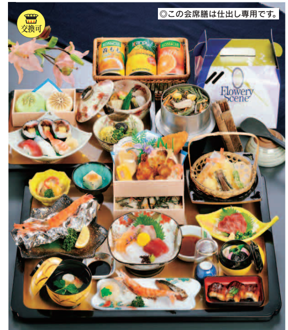
14-20 仏事用会席膳 (詰合せボックス・釜飯付)

通常価格 7,000円を 特別価格 6,000円 (通常より1,000円お得) 消費税込