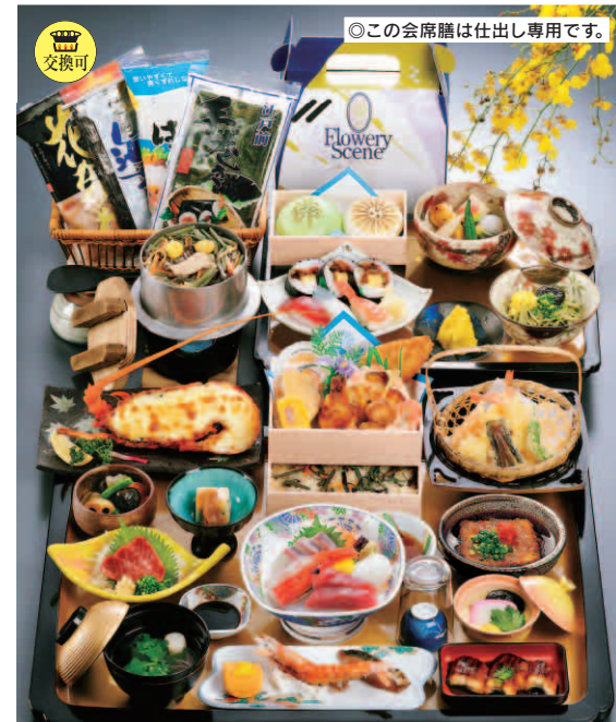
13-19 仏事用会席膳 (詰合せボックス・釜飯付)

通常価格 8,500円を 特別価格 7,200円 (通常より1,300円お得) 消費税込